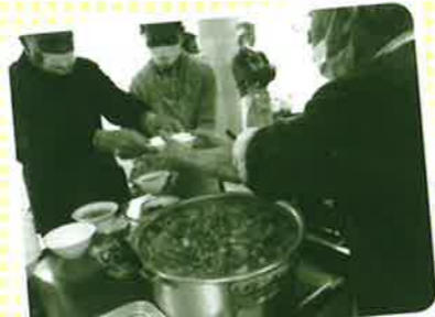
男の料理教室のおにぎりと トン汁は大好評につき、完売！