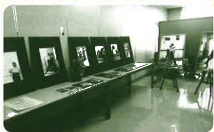
写真展が初登場。フェスティバルのテーマに合わせた白黒の写真作品がスラリ