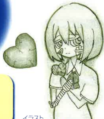
イラスト 園田学園女子大学つながりプロジェクト 学生 作成