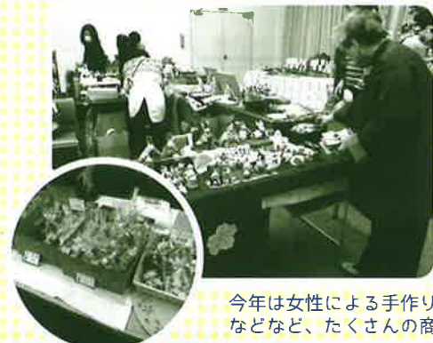
今年は女性による手作りのちりめん細工人形、スイーツ、アクセサリーなどなど、たくさんの商品が、3階ホールに並びました

作品展示や体験講座、公開講座、フリーマーケット、手作り商品の販売など、34団体が参加し、2日間にわたり、おおいに賑わいました。