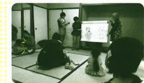
大型絵本の登場！読み聞かせには、子どもも大人もにっこり笑顔