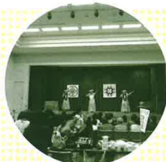
舞台では、フラダンスの発表 ホールがハワイのムードに包まれます