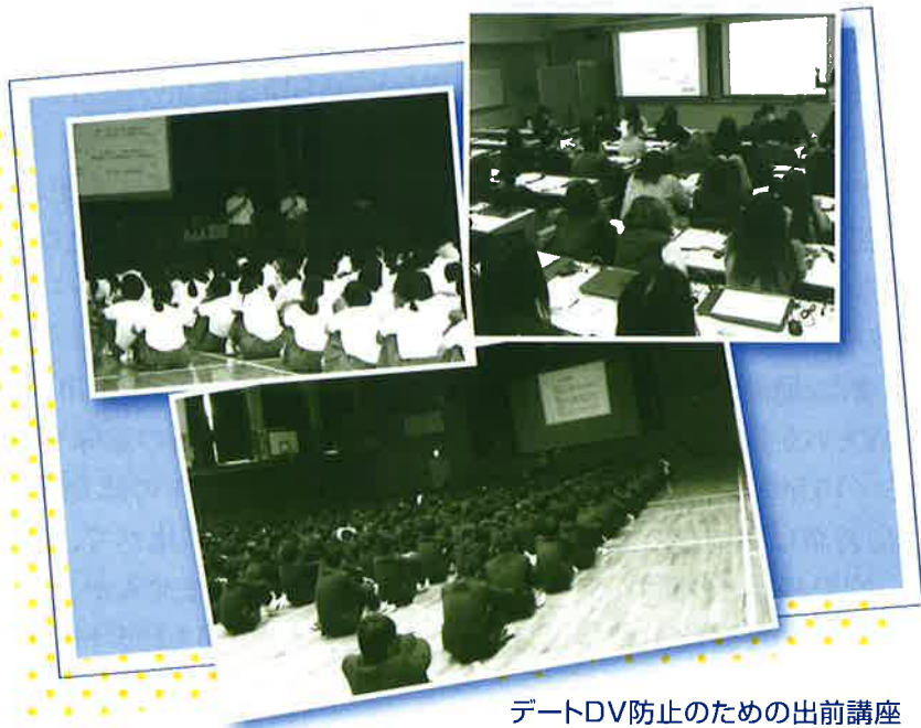
デートDV防止のための出前講座