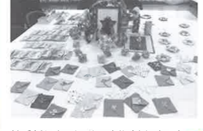
絵手紙や色とりどりの折り紙が並びました。とても素敵!