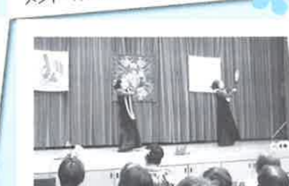
ホールの舞台ではフラグランスの発表。華麗なダンスにうっとり