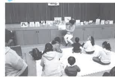
絵本の読み聞かせは、子どももおとなもみんなほっこり笑顔