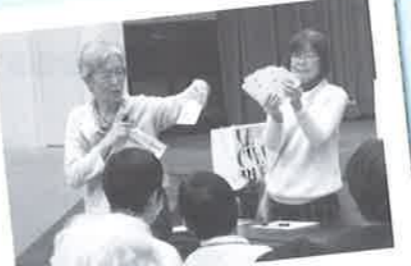
ビンゴで楽しく学ぶ憲法クイズとても盛り上がりました!