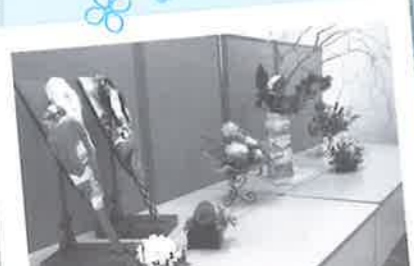
春のお花が華やかに。フラワーアレンジメントの体験も人気