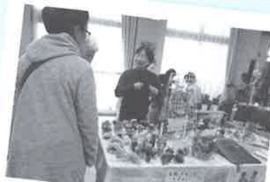
女性たちが丁寧に作ったハンドメイド商品が人気です!